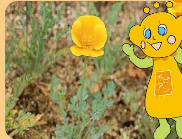
⑪カリフォルニアポピー