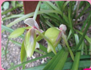
⑤シュンラン 3/7~11 春の洋ラン展