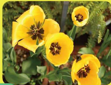
③早咲きチューリップ