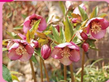
⑧クリスマスローズ 3/3 クリスマスローズ展示会